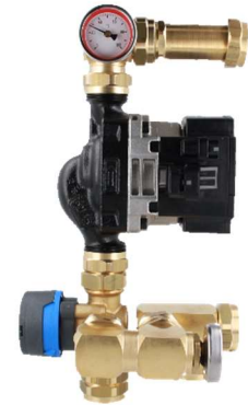
Rys. 1 Moduł mieszający BRU z zaworem ARV ProClick

Moduł mieszający BRU do ogrzewania podłogowego z zaworem ARV ProClick został zaprojektowany jako łącznik pomiędzy instalacją grzewczą po stronie źródła ciepła, a rozdzielaczem ogrzewania płaszczyznowego (np. podłogowego). Służy do przygotowania czynnika o odpowiedniej temperaturze, który następnie będzie tłoczony do pętli grzewczych rozdzielacza. Wyposażony jest w obrotowy zawór mieszający ARV 362 ProClick. Stopień zmieszania na wyjściu z modułu można ustawić ręcznie, przy użyciu pokrętła zaworu. Zalecamy jednak użycie siłownika elektrycznego ARM ProClick lub odpowiedniego regulatora (np. ACT) do sterowania temperaturą wody zmieszanej. Moduł może być wykorzystywany w połączeniu z rozdzielaczami o ilości obiegów grzewczych od 2 do 18.