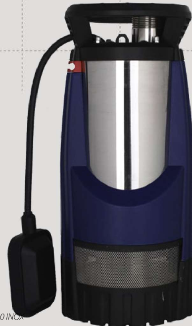
fot. MULTI IP 1000 INOX

Pompowanie czystej wody, podlewanie, zaopatrywania w wodę domów i gospodarstw rolnych ze studni kręgowych, wypompowywania wody z zalanych pomieszczeń, czy opróżniania basenów.